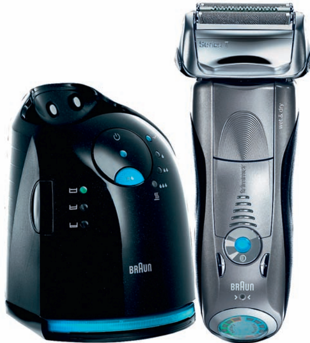
Braun Series 7: Nass und trocken rasieren