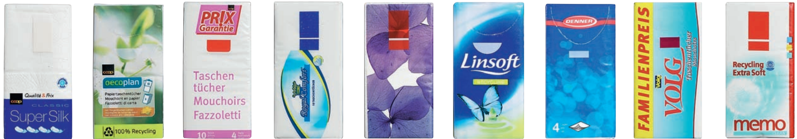
Coop Qualité & Prix Coop Oecoplan Coop Prix Garantie Royal Comfort Softstar Linsoft Denner Volg Memo