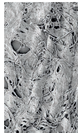
Vergrösserte Fasern: Taschentuch unter dem Rasterelektronenmikroskop