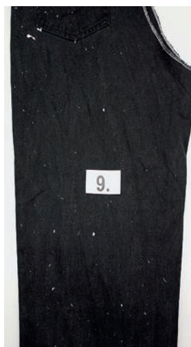
Fusseltest: Jedes Produkt wurde mit dunklen Kleidern gewaschen