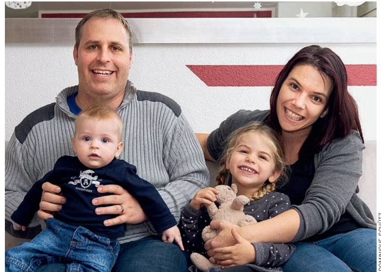
Familie Schwyter: Fand in Zürich verständnisvolles Zoo-Personal