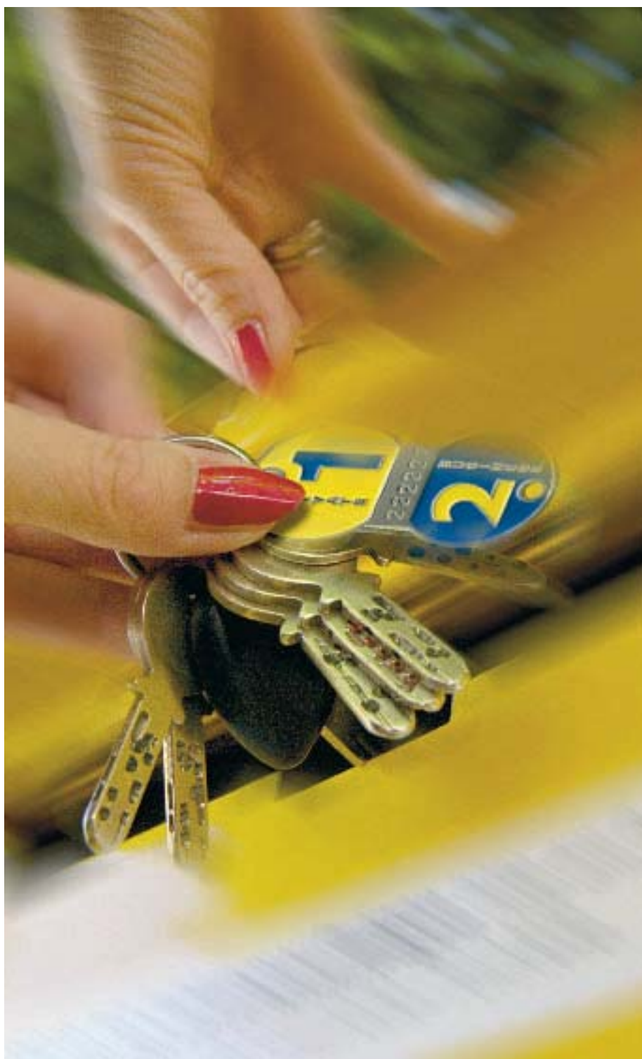
Ab in den Briefkasten mit dem Fund: Wer am Schlüsselbund eine Marke hat (im Bild der Testsieger), erhält die verlorenen Schlüssel ziemlich sicher zurück

Schlüsselfund-Firmen im Test: Der K-Tipp sagt, welches der beste Fundservice ist